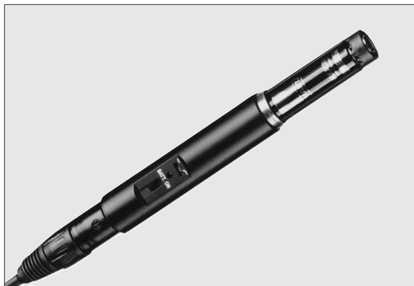
Das abgebildete Kabel gehört nicht zum Lieferumfang.