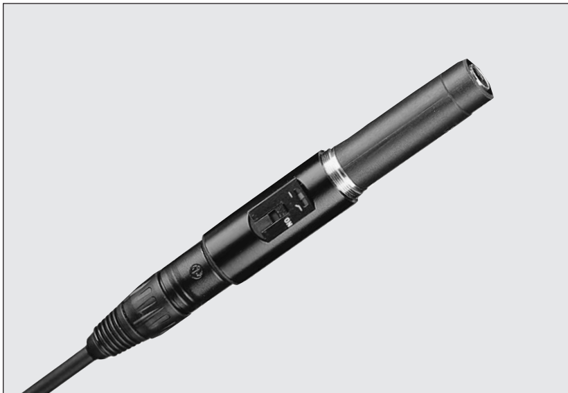
Das abgebildete Kabel gehört nicht zum Lieferumfang.