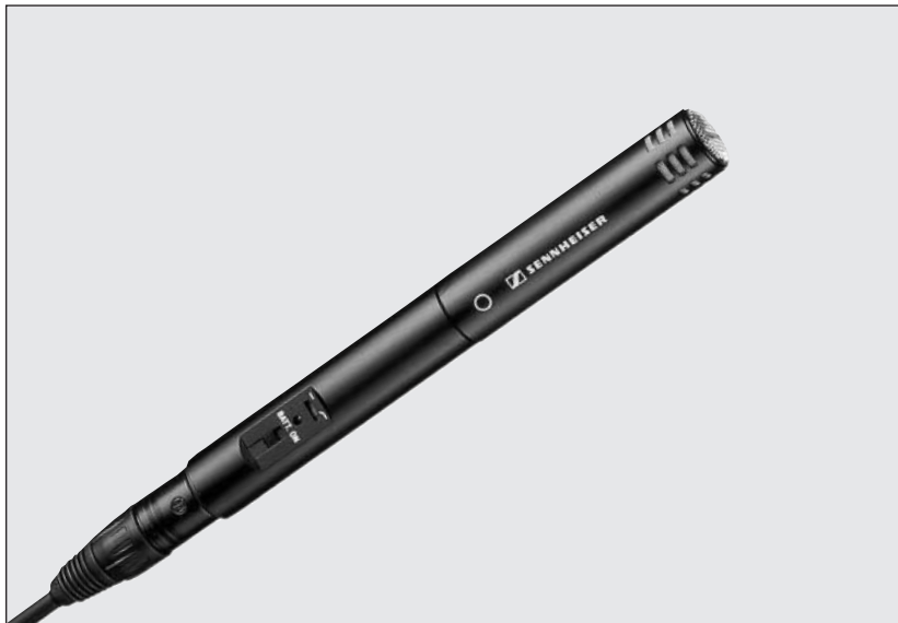
Der abgebildete Speiseadapter K6 gehört nicht zum Lieferumfang.